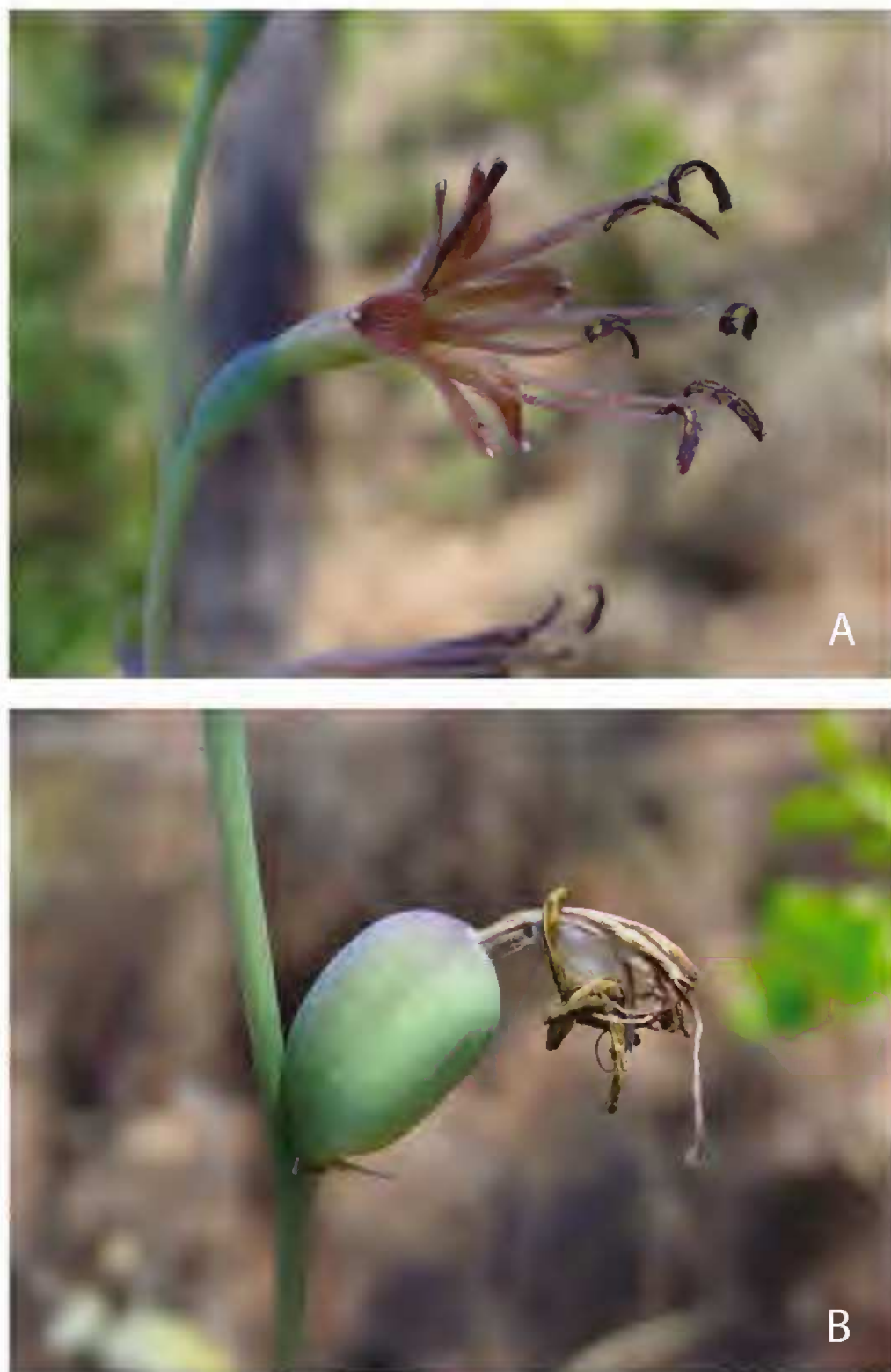
Fig. 2. Manfreda involuta . A. flor. B. fruto (A. Rodríguez y A. L. Pérez-Álvarez 4852, IBUG).

13.VII.2003 fl., A. Rodríguez 3107 (CHAPA, ENCB, IBUG, IEB, MEXU, XAL); ibid., 5.VII.2004 fl., A. Rodríguez y C. Briseño 3660 (IBUG, IEB, MEXU, XAL). Zacatecas: municipio de Teúl de González Ortega, 0.5 km al S de Huitzila por el camino a La Lobera, alt. 1720 m, 21°12' N, 103°36' W, 9.IV.2001. fl., P. Carrillo-Reyes y E. M. Barba 1631 (IBUG, MEXU).